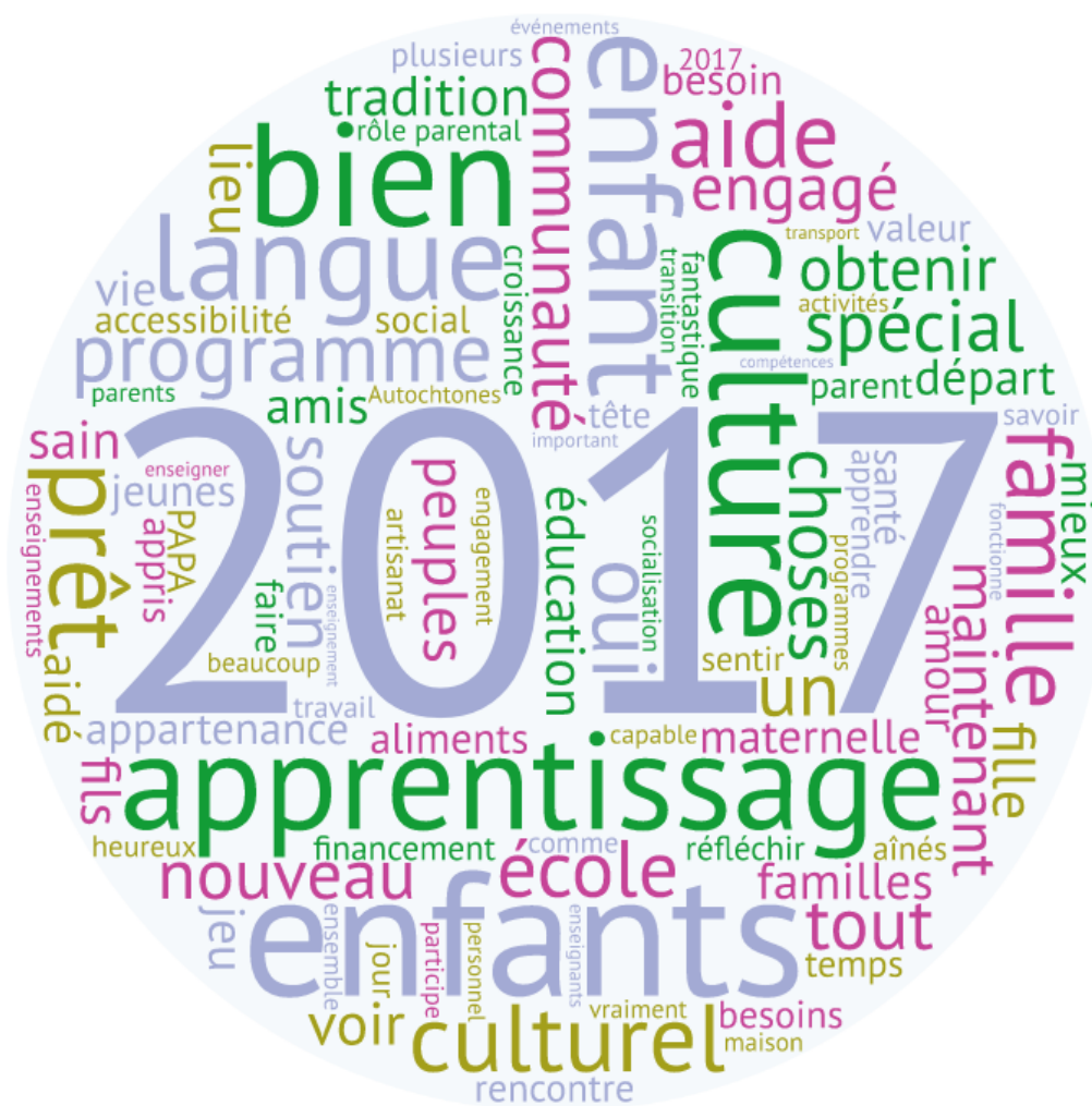
Figure 1. Mots les plus fréquents

figurant dans les réponses et non pas à partir de théories préétablies. Toutefois, il se trouve que les six composantes du PAPACUN se sont tout naturellement imposées comme catégories thématiques : (a) culture et langue, (b) éducation, (c) promotion de la santé, (d) nutrition, (e) soutien social, et (f) participation des parents et de la famille. Une fois que toutes les réponses ont été importées dans NVivo, le programme a généré un nuage de mots-clés à partir des 1 000 mots qui revenaient le plus fréquemment.